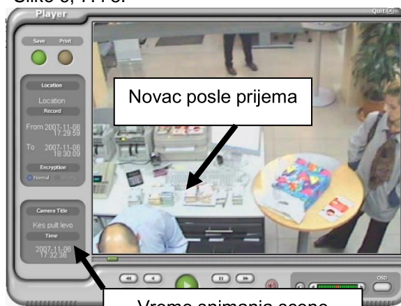
Slika 6. Vremeni raspored novca nakon predaje

Veštačenje u oblasti IT, pored visokog nivoa stručnosti zahteva i veštinu korišćenja tehnike, „oštro oko“, itd. U parnici (2008/2012) koja je trebala da reši problem krađe novca veštak je zahvaljujući veštini doveo u sumnju mogućnost krađe novca od strane službenika banke – brojača novca. Naime, klijentu banke je tokom primopredaje novca u banci, u iznosu oko 100.000,00 EUR, nestalo oko 35.000,00 EUR. Slike 6, 7. i 8.