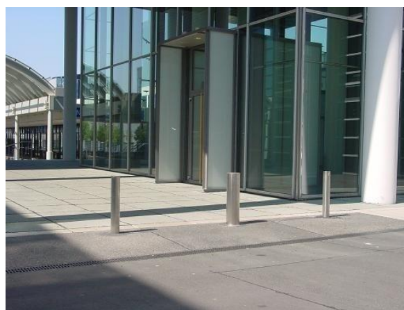
Slika 3. Potapajući stubići

Veštak se, pre veštačenja, nikad ranije nije sretao sa tom tehnologijom. Barem ne kao problemom. U pitanju je tehnika koja je u funkciji sprečavanja nekontrolisanog ulaska vozila u zabranjene (pešačke) zone. Veštak je prilikom boravka u Francuskoj, u Kampijenu, 1996. godine prvi put video kako funkcionišu ti stubići.