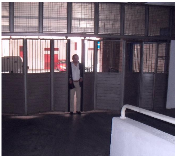
Slika 5. Provera sistema za upravljanje garažnim vratima

Veštak je, inače, u cilju izvođenja korektnog nalaza često pribegavao simulacijama – eksperimentu. U parnici, pod kodnim imenom „garaža“, praktično je proveravan sistem (polu)automatskog funkcionisanja (garažnih) vrata, Slika 5. Naime, jednom od korisnika zajedničke garaže, prilikom izlaska iz garaže, garažna vrata su izgrebala karoseriju. Vrata su se u skladu sa propisanom procedurom zatvarala prilikom prolaska oštećenog vozila.