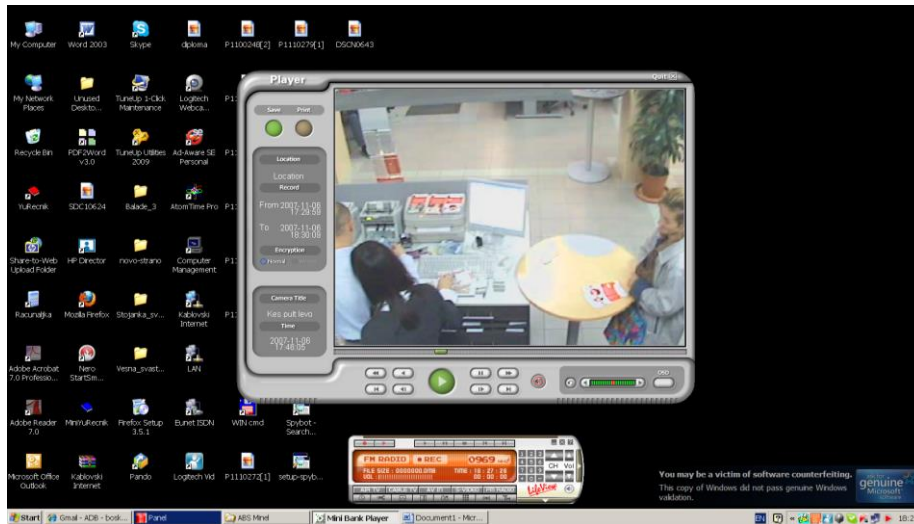
Slika 8. Brojačica nosi novac levo, druga trećina pete sekunde

Napominjemo da su sve ostale kamere bile isključene osim ove koja je zabeležila priložene snimke. Slučajno!?