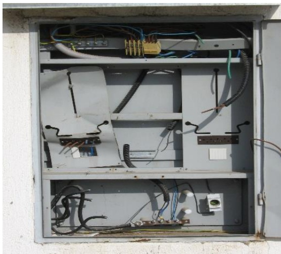
Slika 2. Jedan od mnogobrojnih uništenih/opljačkanih razvodnih ormarića za struju

troškove za revitalizaciju celog sistema. Posebno sa aspekta „izgubljene dobiti“ !!! 3 . Epilog: veštak je uspešno rešio zahtev oštećenog.