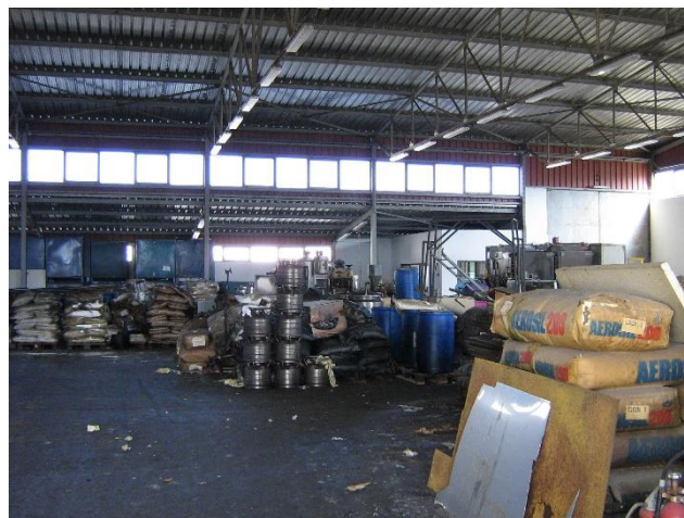
Slika 1. Deo (uništenog) magacinskog prostora

procena štete po elektrotehnici na objektima u kojim su se navodno proizvodile sintetičke droge 2 . Objekti su bili u selu U. Naime, nakon što su organi unutrašnjih poslova preuzeli „staranje“ nad objektima u selu došlo je do oštećivanja istih praćeno pljačkom svega i svačega što se moglo izneti iz objekata i, pre svega, iskoristiti. Ono što nije moglo da se koristi (oprema, infrastruktura) uništeno je do stepena pretvaranja pokretnih sredstava u furdu. Da bi se veštačenje „formalno pokrilo“ oštećeni je samo pitao veštaka da li poseduje dokument (rešenje) po kojem je ovlašćen da veštači i na elektrotehničkoj opremi. Veštak je odgovorio pozitivno. Grubo uzevši veštak je dobio posao „na reč“.