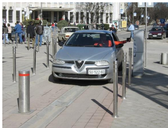
Slika 4. „Optuženi“ stubić

Ispitivanje, dokazivanje, „krivice“ stubića provereno je i putem eksperimenta. Simulacija – eksperiment je dokazao da je stubić funkcionisao u skladu sa ugovorom (deklaracijom) o ispravnosti sistema.