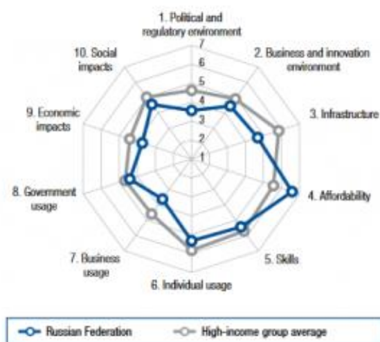
Slika 1. Indeks dostupnosti mreže, Rusija, 2016. (Kostilleva, 2016)

Rusija je generalno dobila 4,5 poena u rangu. Za poređenje, lideri - Singapur, Finska ostvarili su po 6 bodova.