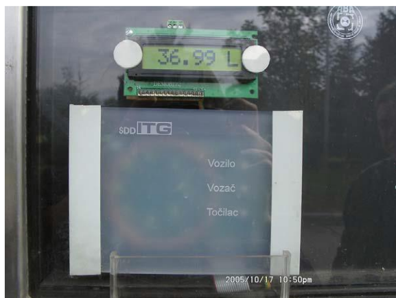
Slika 3. Antena čitača ID kartica vozača i točioca

Izvor: (Čekerevac, Matic, Djuric, & Čelebić, 2006)