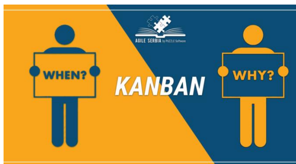
Slika 1. Kanban metod u IT okruženju (n.d, 2019)

Kanban je najpopularniji agilni okvir i veoma primenljiv, a zasnovan je na njegovim vrednostima i principima, odnosno zna se tačno - kada i zašto ga koristiti (slika 1).