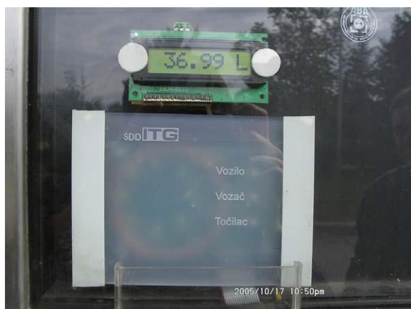
Slika 3. Antena čitača ID kartica vozača i točioca